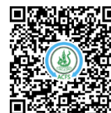
น้ำเคยข้าวเำ