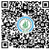
ทุเรียนพวงมณี