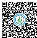
ทุเรียนชะนี

๕. MOSA FARM ตั้งอยู่เลขที่ ๓๕ หมู่ที่ ๖ ตำบลเนินทราย อำเภอเมืองตราด จังหวัดตราด จัดทำ QR Code สำหรับผลไม้