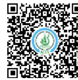
ทุเรียนนงหีบ